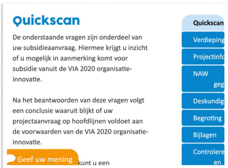
Figuur 1: screenshot wegvallende teksten bij inzoomen

Bij het inzoomen gaat het niet overal goed. Zo vallen de stappen in de aanvraag dan deels weg.